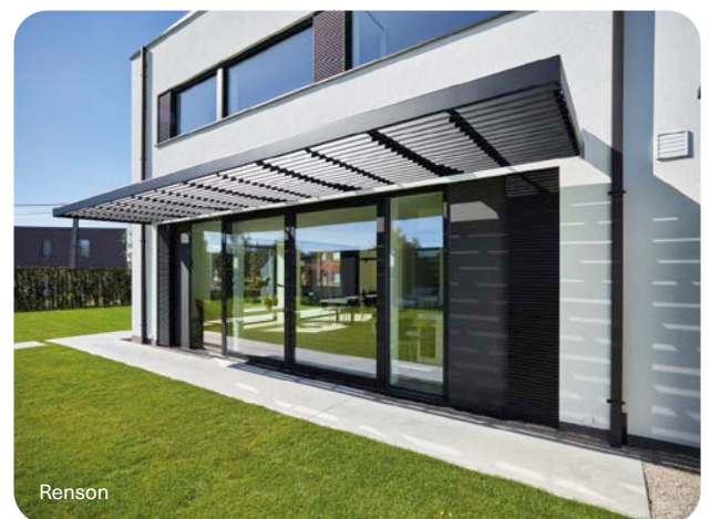
1 Voorbeeld van een vaste zonnewering.

Ten derde, als de passieve maatregelen alleen niet volstaan om het gewenste comfort te bereiken, moet er prioritair